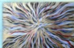
Z ciemności w jasność