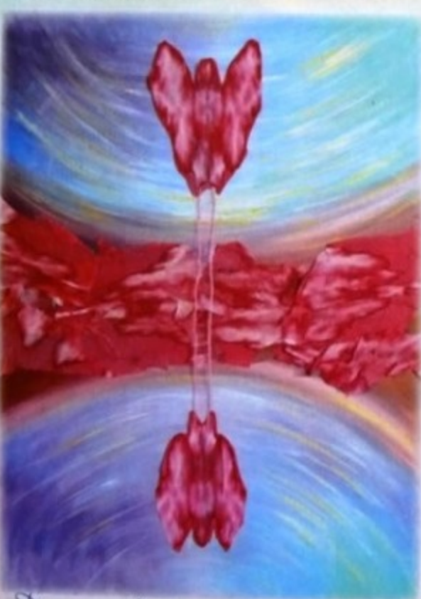
Droga prowadzi przez serce

W 1988 roku, po 14-tu latach przygotowań Curt rozpoczął rozpowszechnianie Vedic Art w całej Skandynawii. Pierwsze kursy w Polsce odbyły się w 2005 roku, a dziś w naszym kraju jest trzech autoryzowanych nauczycieli Vedic Art.