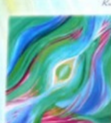
Obraz mojego serca