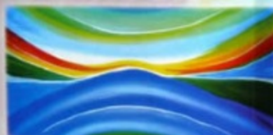
Przebiegi i kulisy